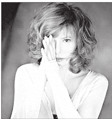
Фота прадстаўлена Мілен Фармэр кампаніі «Праваабаронцы супраць смяротнага пакарання ў Беларусі»

«І не можа быць мэты больш высокай, больш святой, больш годнай за гэтую: пакончыць з пакараннем смерцю», - падпісаўшы петыцыю, Мілен Фармэр працігавала гэтыя радкі. Яны належаць французскаму пісьменніку Віктору Гюго, які ў прадмове да аповесці «Апошні дзень асуджанага» (1829) выступіў заўзятым праціўнікам смяротнага пакарання, запытваючыся, адкуль у аднаго чалавека з'яўляецца права пазбаўляць жыцця іншага, і сцвярджаючы, што яго роля - «роля заступніка за ўсіх магчымых падсудных, вінаватых або ня-