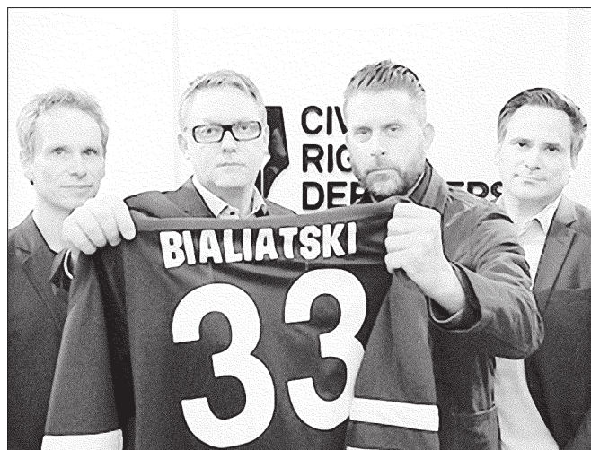
Civil Rights Defenders